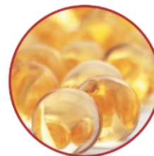
Витамины А, С, Е