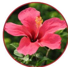
Экстракты гибискуса и шиповника