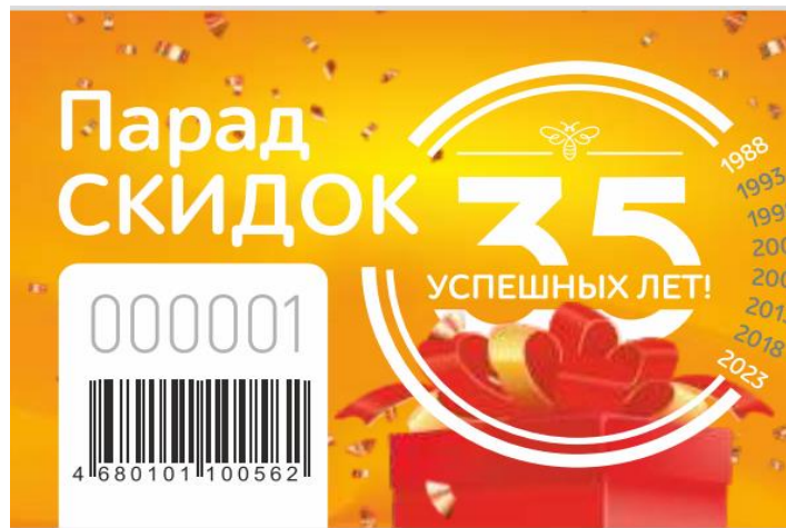
Рис.1. Лицевая сторона скретч-карты